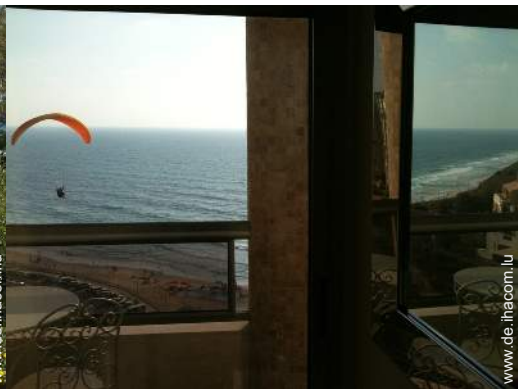
Flugsport in der Nähe