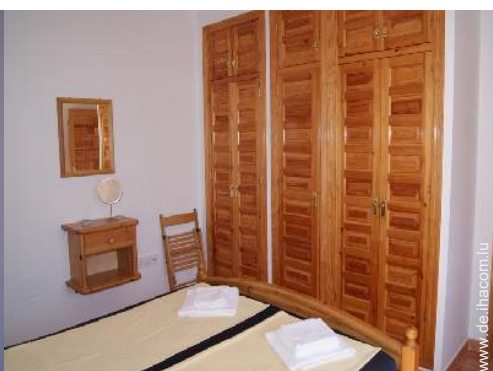
Innenkomfort und Ausstattung