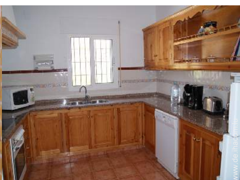
große amerikanische Küche