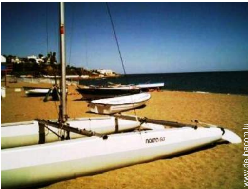
direkter Zugang zum Strand