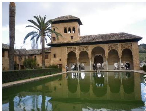
Nahe gelegene Städte