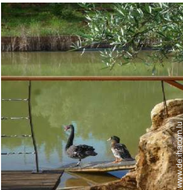
Vor Ort anwesend