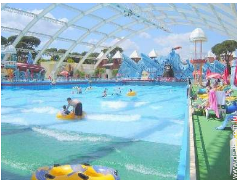
Wassersport in der Nähe