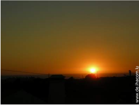
Blick auf Sonnenuntergang