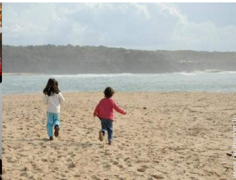
Badevergnügen in der Nähe