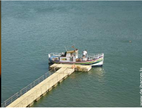
Flugsport in der Nähe