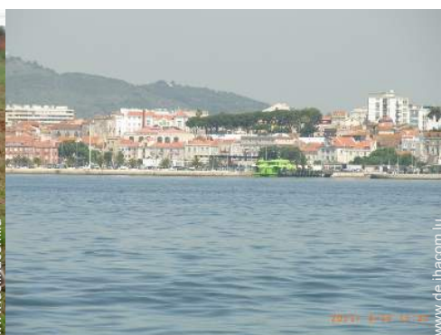
Badevergnügen in der Nähe