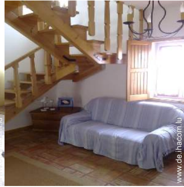
Sofabett(en) 2 Personen